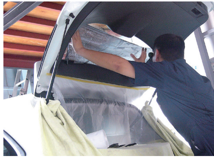
②フィルムをガラス面に合わせて…