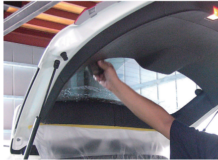
④気泡を丁寧に除去し、丁寧なチェック後作業完了。