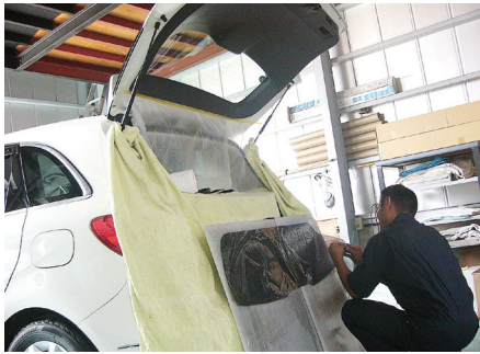
①ガラス面に特殊な液剤を塗布して施工の準備