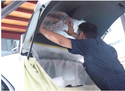
③素早い作業でぴったりフィルム施工